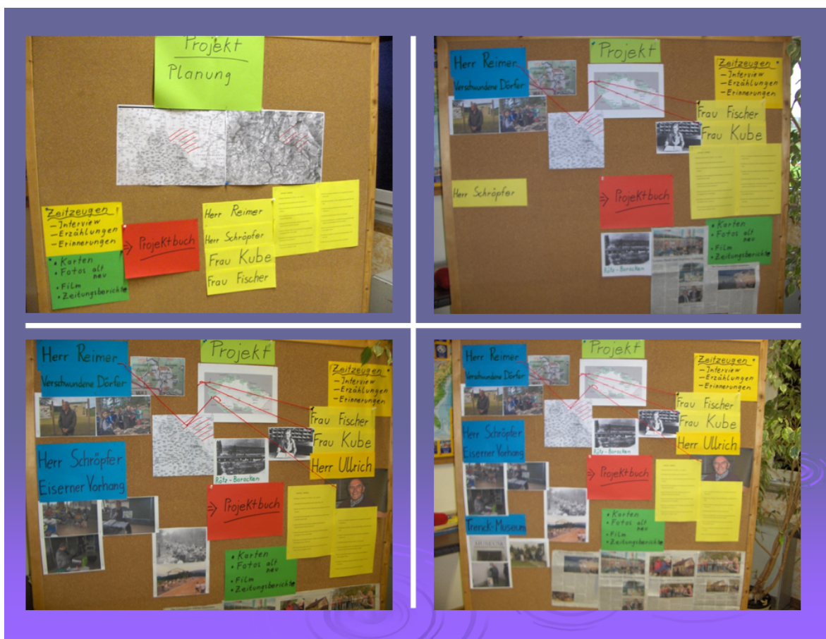
Záznam a plánování jednotlivých aktivit v průběhu projektu pomocí nástěnky žáků 8. třídy Mittelschule Rötz.

Žáci z Mittelschule Roetz vedli zároveň s knihou také projektovou nástěnku (viz obrázek níže).